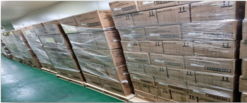
WALGREENS Business Award(수주)